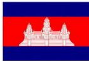
Re-adopted 30 Jun 1993