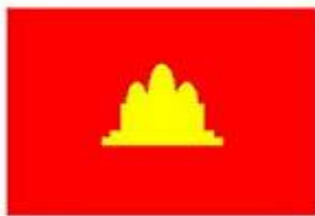
5 Jan 1976 - 7 Jan 1979