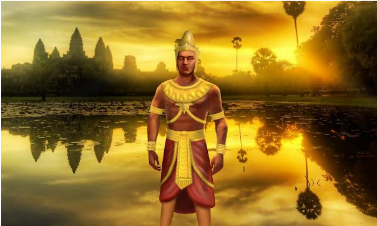
ព្រះរាជាខ្មែរ