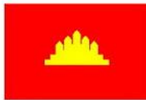
7 Jan 1979 - 1 May 1989