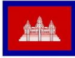
1863 - 20 Oct 1948