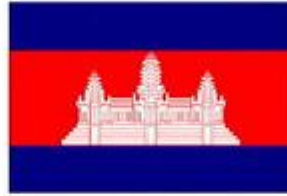
20 Oct 1948 - 9 Oct 1970; 17 Apr 1975 - 5 Jan 1976