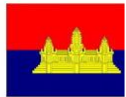
1 May 1989 - 24 Jun 1992