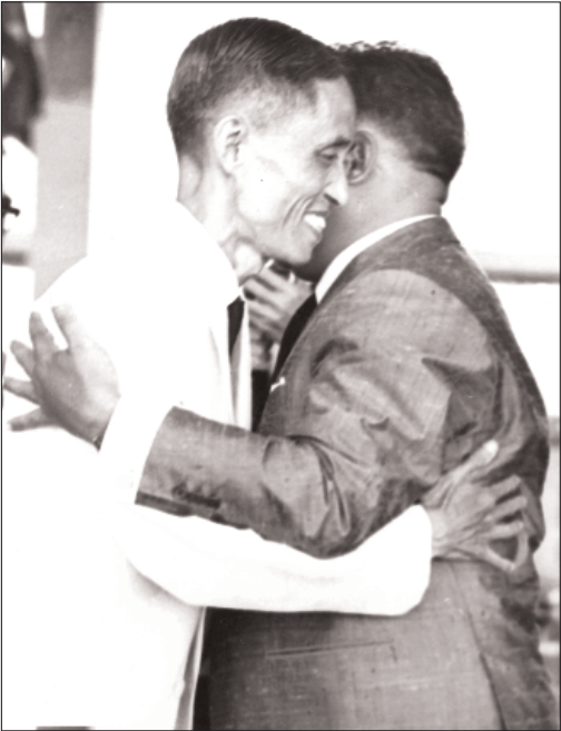
ត្រាន់-ប៊ូគៀម និង នរោត្តម-សីហនុ

កើតនៅឆ្នាំ១៩២០ ឯកងថី, ត្រាន់-ប៊ូគៀម ជាប្រធាននៃសហភាពនិស្សិតរំដោះ និងជាសមាជិកនៃគណៈកម្មាធិការមជ្ឈឹមរបស់គណបក្សប្រជាធិបតេយ្យ ។ ក្នុងឋានៈនេះ, នៅឆ្នាំ១៩៤៦, គៀមជាប្រតិភូរបស់បក្សក្នុងគណៈកម្មាធិការមជ្ឈឹម «លៀន ឡឺត» ហើយព្រមជាមួយគ្នា ជាអនុប្រធានផ្នែកសេដ្ឋកិច្ចនៃរដ្ឋាភិបាលបណ្តោះអាសន្នរបស់ហ្វុ-ជីមិញ ។ រហូតដល់កិច្ចព្រមព្រៀងក្រុងហ្សឺណែវ, ត្រាន់-ប៊ូគៀមបានដឹកនាំទ័ពព្រៃយៀកមិញ, បានប្រមូលផ្តុំនិស្សិត ហើយបានធ្វើទំនាក់ទំនងជាច្រើន ជាមួយដៃជើងហ្វុ-ជីមិញ ។ នៅឆ្នាំ១៩៥៤, គៀម បានសំរេចចិត្តទៅហាណូយ ប៉ុន្តែបានត្រឡប់ដោយសម្ងាត់មកយួនខាងត្បូងវិញ នៅឆ្នាំ១៩៦០ ។ ត្រាន់-ប៊ូគៀមត្រូវបានចាត់ទុកជា «ជនក្រហម» ដោយមិត្តចាស់ៗ ។ បន្ទាប់ពីបានដឹកនាំគណប្រតិភូនៃនរណសិរ្សរំដោះយួនខាងត្បូង ក្នុងកិច្ចការនាក្រុងប៉ារីសនៅឆ្នាំ១៩៦៩ ត្រាន់-