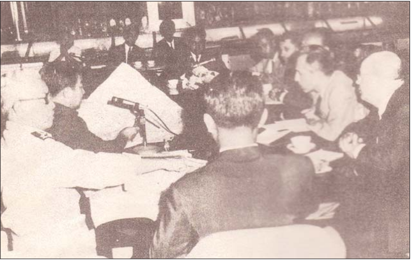
ស្តេចសីហនុកំពុងបង្ហាញផែនទីជំរកយៀកកុងនៅលើទឹកដីខ្មែរដល់ពួកអ្នកកាសែត (ថ្ងៃទី២៨ មិថុនា ១៩៦៩)

សីហនុពុំមែនមិនដឹងទេថា តាំងពីច្រើនឆ្នាំមកហើយ កងកម្លាំងយួនខាងជើង និងយៀកកុងបានមកតាំងនៅតាមផ្នែកទាំងឡាយ ដែលមិនសូវសំបូរប្រជាជនក្នុងរាជាណាចក្រ, នៅខេត្តនានាខាងភូមិភាគឦសាន ។ នៅខណៈដែលគាត់បានទទួលស្គាល់រដ្ឋាភិបាលឧទ្ទាម គឺរដ្ឋាភិបាលបដិវត្តន៍បណ្តោះអាសន្នយៀកកុង, សីហនុជំទាស់, ព្រមពេលគ្នានិងជាលើកទីមួយ, ដល់ការកាត់កាប់នៅលើផ្នែកមួយចំនួននៃខេត្តទាំងឡាយរបស់ខ្មែរ ដោយពួកកុម្មុយនិស្តយួន ។ ក្នុងសន្និសីទសារពត៌មានរបស់គាត់ នៅថ្ងៃទី១១ មិថុនា ១៩៦៩ សីហនុបានអះអាងថា ក្នុងខេត្តរតនគិរីដែល