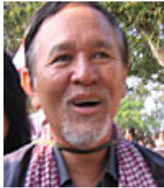
ប្រធានបក្ស សិទ្ធិចនុស្ស