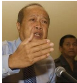
ប្រធានបក្ស សោត្តចរសេរិទ្ធិ