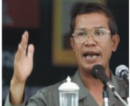
បើចង់រកយុត្តិធម៌អោយខ្មែរ ត្រូវកាត់ទោស ប៉ុល ពត និង សីហនុ ហ៊ុន សែន យួន មិន ថែរ