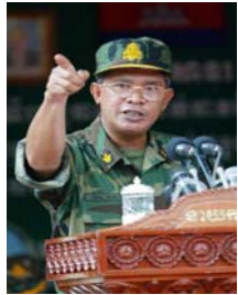
ប្រធានបក្ស ប្រជាជនកម្ពុជា