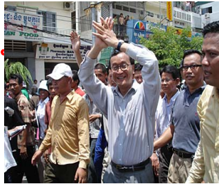
ប្រធានបក្ស សមរង្ស៊ី