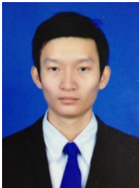
ល. ង៉ោ ហ្គេចឡេង