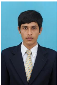
ល. ប្រាក់ ដារ