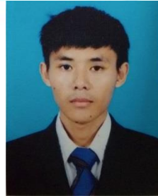
ល. គ្រី សុផាន់ណាត់