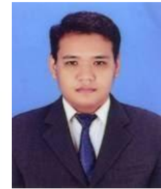
ល. ប្រាប វិទ្ធី