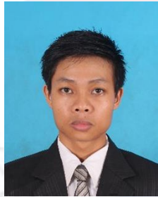
ហ៊ូ គាណាន់