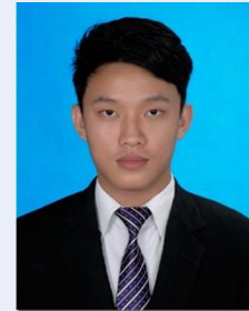
ហ៊ី ឡេងសែ