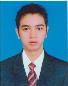
ស ម៉ាបូរ៉ា